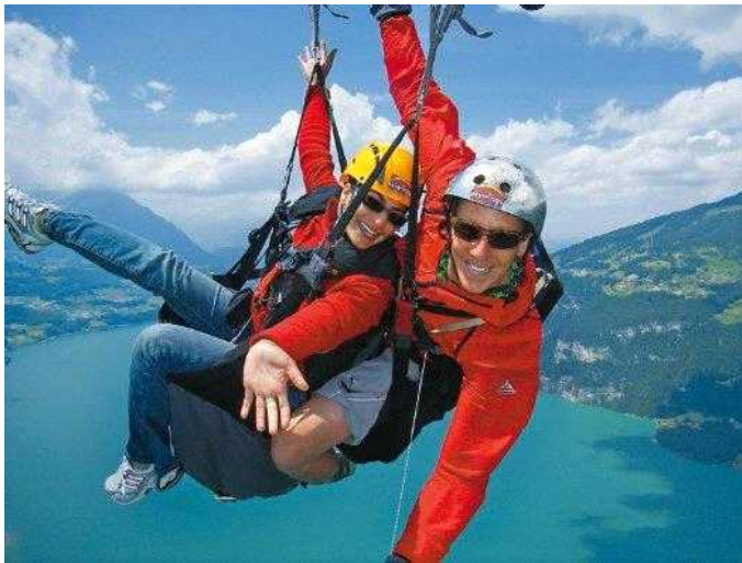
구글 이미지.

단, 항공기 이용시 본인 및 부모 1인 출국(인천,김포) 탑승권 (또는 출입국사실확인서) 반드시 첨부