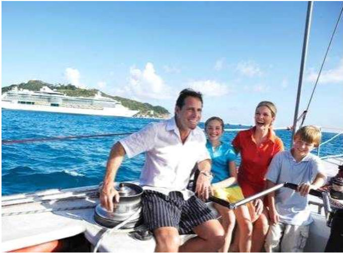
구글 이미지. 출처 www.rccl.kr