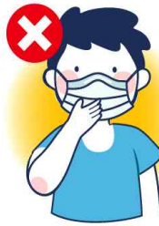
걸을 만지는 행위