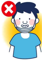
턱에 걸치는 착용