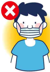
입만 가리는 착용