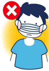
코만 가리는 착용